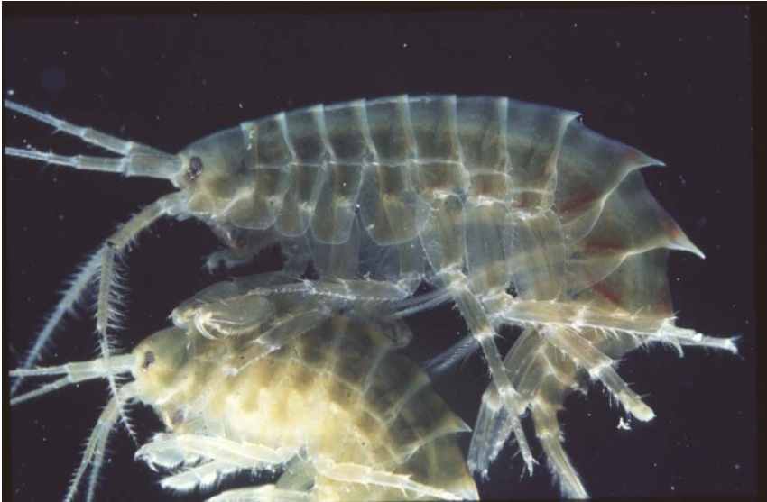
Parček osáte postranice ( Gammarus roeselii ).