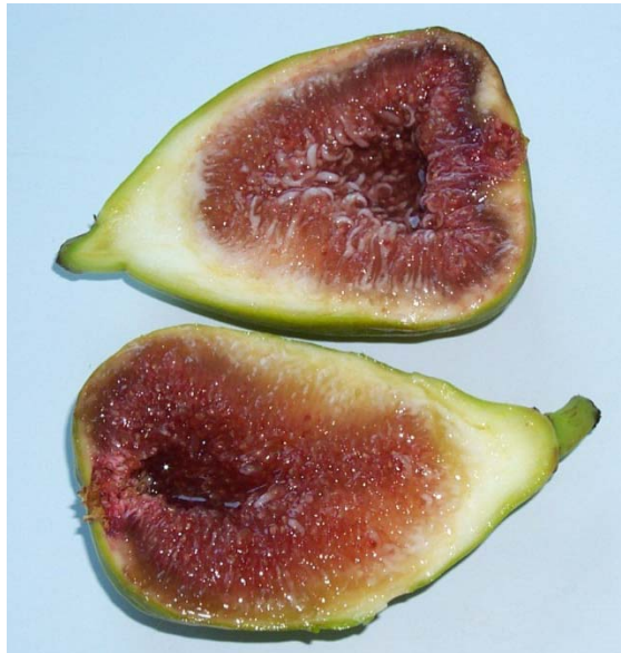
Zreli plodovi fige

Vir: SLATNAR, Ana, KLANČAR, Urška, ŠTAMPAR, Franci, VEBERIČ, Robert. Effect of drying of figs ( Ficus carica L.) on the content of sugars, organic acids and phenolic compounds. J. agric. food chem. , 2011, vol. 59, no. 21, str. 11696-11702.